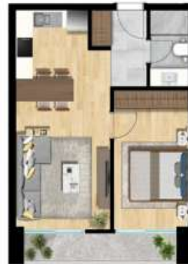
1+1 TİP 2 A BLOK