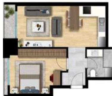
1+1 TİP 1 A BLOK