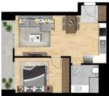
1+1 TİP 4 A BLOK